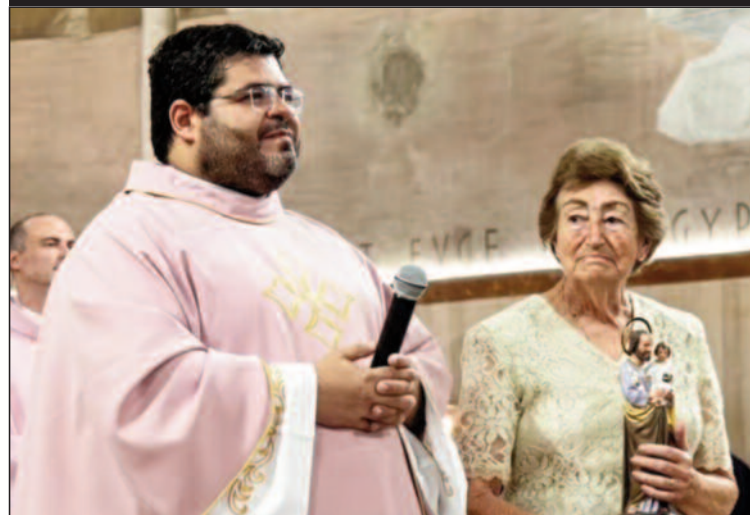
130ª Festa de São José termina nesta terça-feira (19)

Festa do padroeiro resgata tradições católicas na Estância