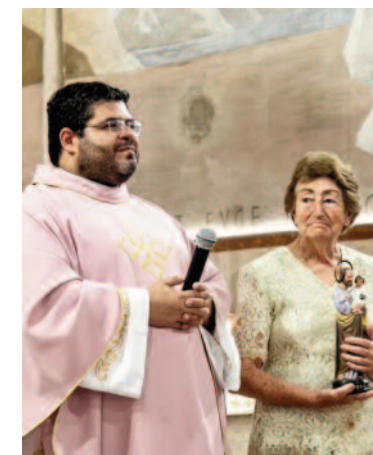
130ª edição da Festa de São José chega ao fim nesta terça-feira (19)