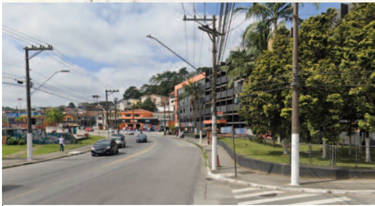
Expansão da Av. Francisco Monteiro é um dos marcos destes 70 anos

Quem viveu o período de transição de uma Ribeirão Pires que pertencia a Santo André para uma Ribeirão Pires independente, observou de perto as transformações impulsionadas pela emancipação político-administrativa.