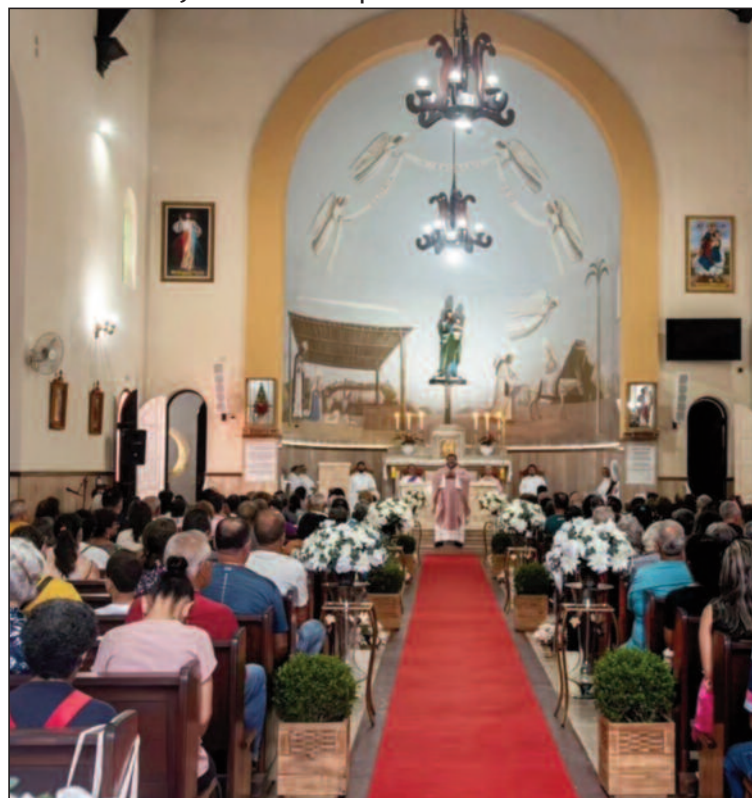
Ribeirão Pires celebra a Festa de São José desde 1894

130ª edição festa do padroeiro da Estância foi marcada por ações fora da igreja como carreatas e bênção em estabelecimentos