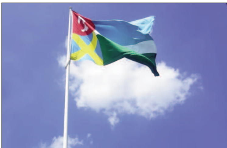
RP completa 70 anos de emancipação político-administrativa