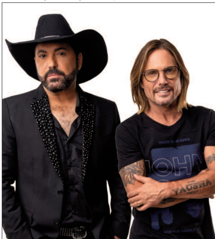
Edson & Hudson se apresentarão no Aniversário da Estância, às 20h

Dupla fará apresentação de aniversário, no dia 19; Frank Aguiar, Chico César e Geraldo Azevedo estarão na Entoada Nordestina