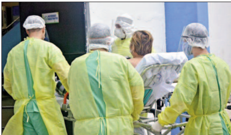
De 6 a 9 de julho, casos aumentaram 13,7% nas duas cidades

727 pessoas foram infectadas pela Covid-19 em Ribeirão Pires e Rio Grande