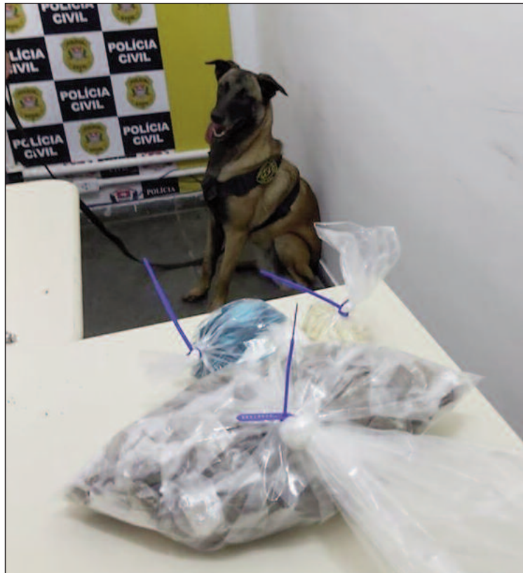
Animais estão fazendo a diferença na apreensão de drogas em RGS

A ocorrência foi registrada na Delegacia de Rio Grande da Serra, para onde o material ilícito foi encaminhado. Ninguém foi preso.