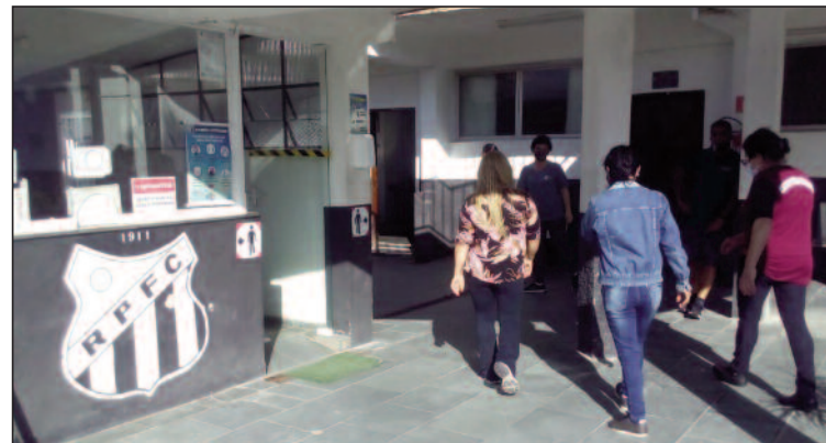
Espaço foi liberado pela Prefeitura por meio de decreto