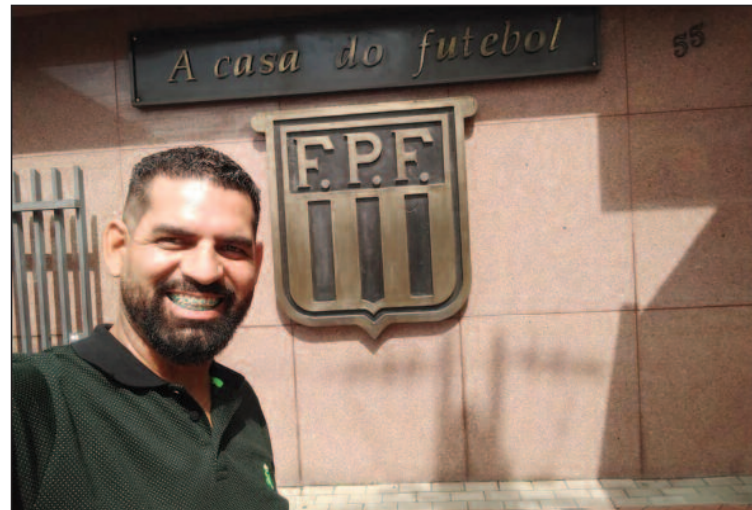
Danda é o presidente da União das Ligas do ABC

durante esse período delicado para todos. "Quero também me colocar à disposição dos presidentes e diretores dos clubes para sanar dúvidas com relação ao andamento da Liga nesse período, e dizer que o futebol amador da