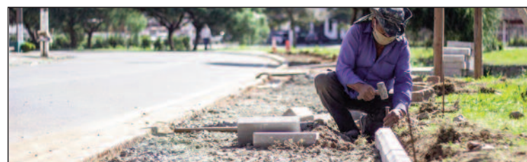
Nova fase do Parque Linear terá 2,4km de extensão