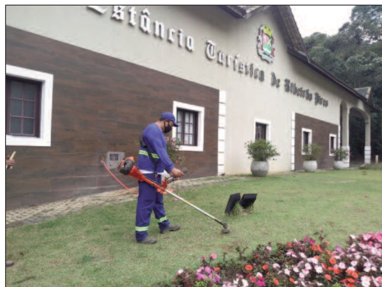
Há três anos, o funcionário é responsável pela limpeza do local

Moradores e visitantes que percorrem a avenida Kaethe Richers, um dos principais acessos a Estância de Ribeirão Pires, têm a oportunidade de apreciar as belezas naturais da cidade e aproveitar o Parque Linear.