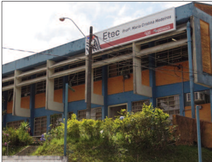
Em Ribeirão Pires e Rio Grande da Serra tem unidades da Etec

Processo seletivo oferece mais de 44 mil vagas. Inscrição vai até dia 21 de julho