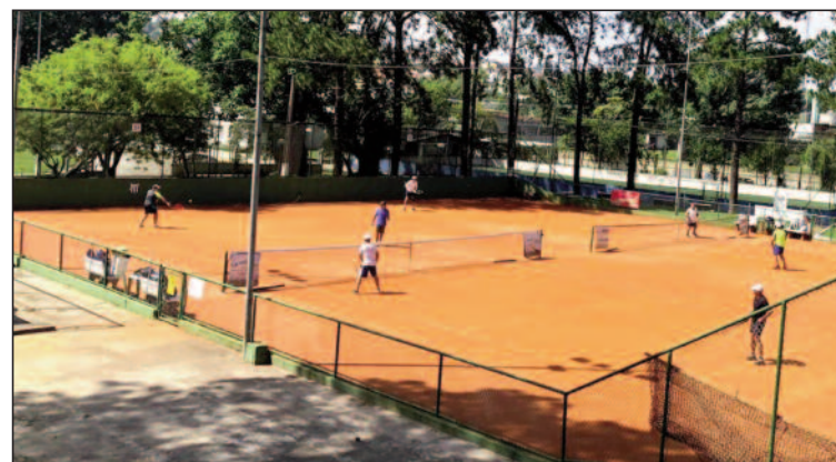
Áreas abertas poderão ser utilizadas para prática de atividades