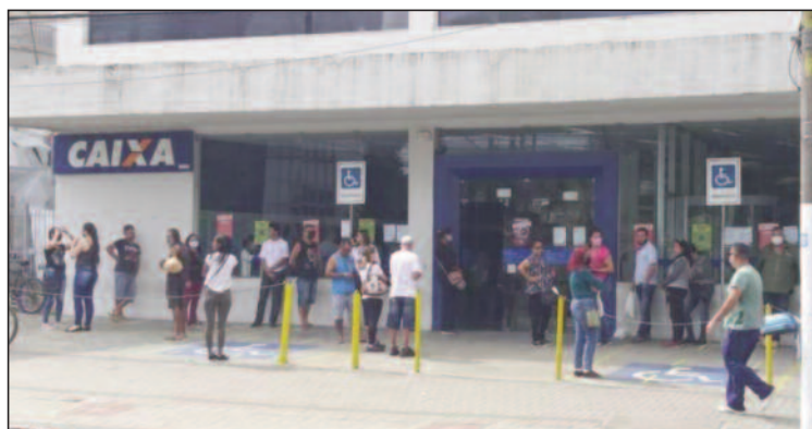
Moradores esperam na fila para receber os R$ 600,00

53 mortos e 727 infectados pelo coronavírus na região