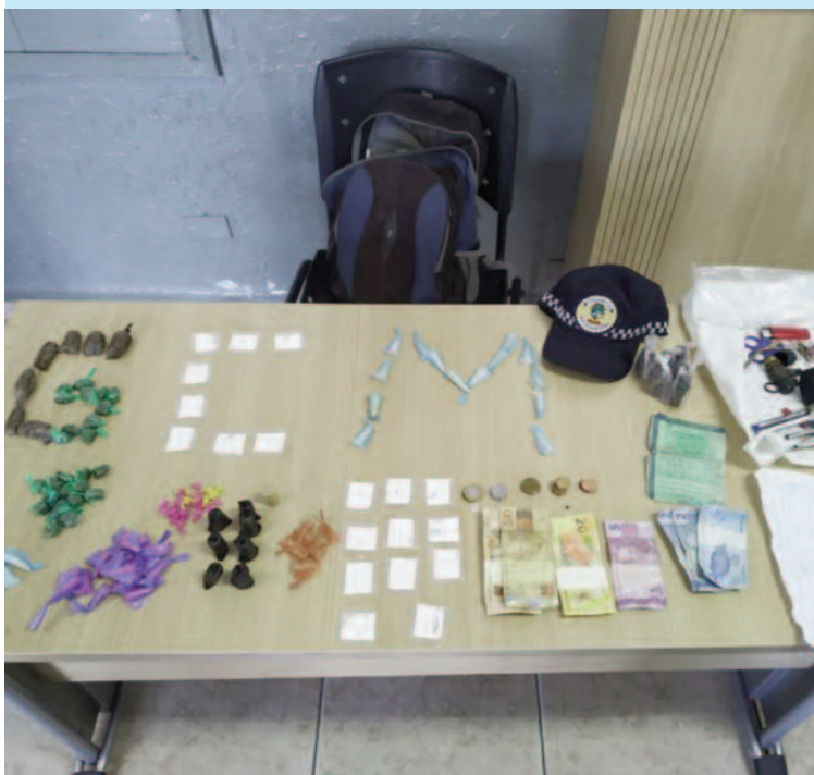
Drogas foram apreendidas e suspeitos presos pela GCM de Rio Grande

Na madrugada de quarta-feira (8), a Guarda Civil Municipal de Rio Grande da Serra prendeu dois homens e uma mulher suspeitos de envolvimento no tráfico de