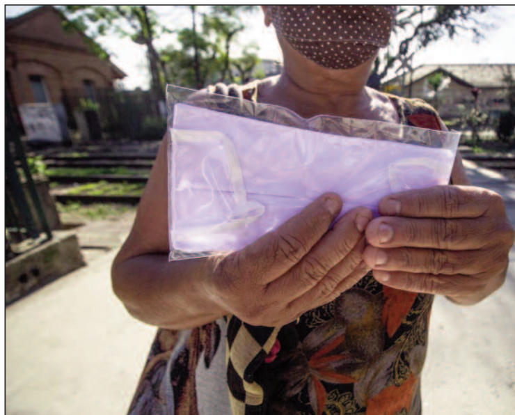
Cada costureira teve remuneração de R$ 2,00 por máscara

20 costureiras formadas pela entidade confeccionaram 6 mil peças