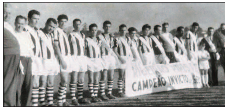
RPFC foi campeão invicto de 1960, em torneio promovido na cidade

Em 1960, a equipe do RPFC tornou-se campeão invicto da cidade. O feito foi repetido em 1966, tornando-se um dos clubes mais bem-sucedidos da região. Embora tenha atuado em outras modalidades esportivas ao longo dos anos, seu reconhecimento e suas principais