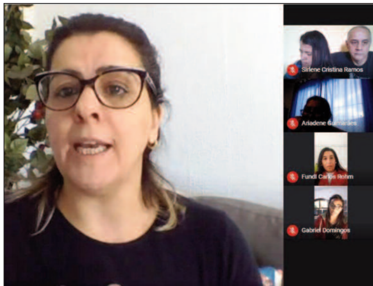
Na última sexta-feira comitê realizou reunião virtual

Grupo discutirá protocolos para preparar redes para futura retomada das atividades presenciais. Ação terá presença de pais e do MP