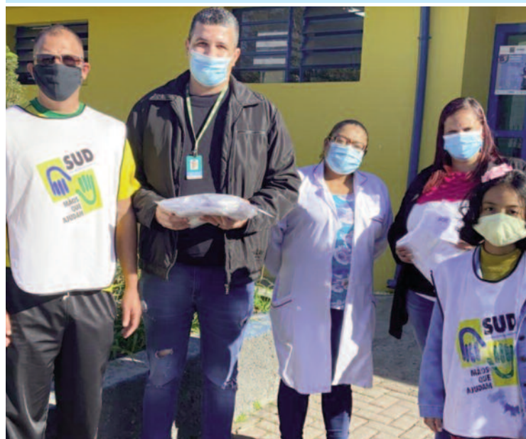
Ação é realizada pela Igreja de Jesus Cristo dos Santos do Últimos Dias

O projeto “Mãos que Ajudam” entregou nas últimas semanas 1.000 máscaras de tecido lavável para os municípios de Rio Grande da Serra. A confecção das máscaras foi resultado de uma ação que mobilizou voluntários para promover o bem-estar e ajudar a salvar vidas. Após sua confecção, o produto foi entregue gratuitamente nas ruas da cidade e nas Unidades Básicas de Saúde.