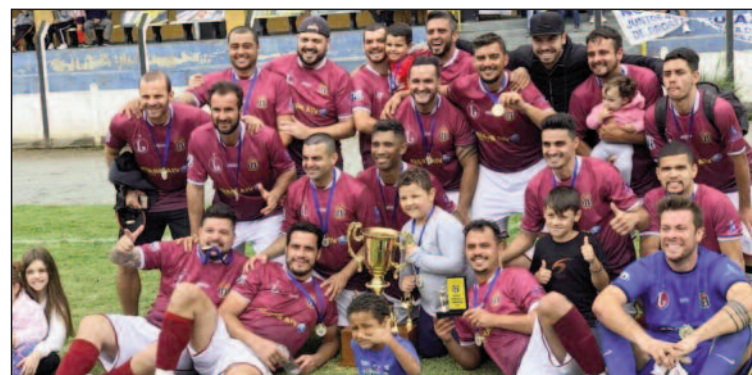
Pé na Bola de 2019 consagrou na categoria principal, a equipe Via Brasil

Em novembro de 2019, o clube promoveu o 39º Torneio Pé na Bola, e consagrou a equipe Via Brasil na categoria principal. É evidente que influência do clube alvinegro na história da cidade aparece até os dias de hoje. Sendo um marco pelo seu centenário e pelo seu 109º aniversário.