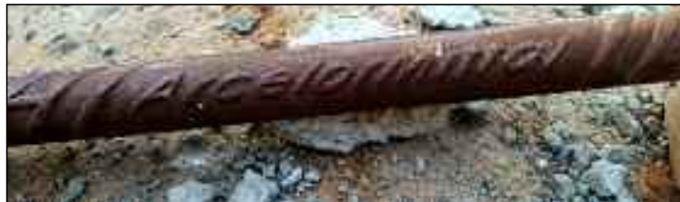
Ferragem armazenada na construção da casa do secretário