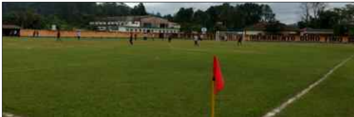
Campo de Ouro Fino abrigou jogos do torneio

Partidas, realizadas no último domingo (17), somaram 12 gols