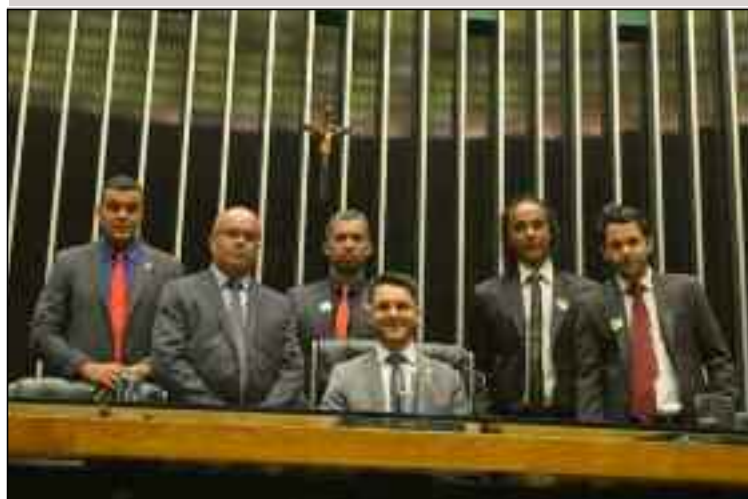
Comitiva de Rio Grande junto do deputado Alex Manente na Câmara dos Deputados

O vereador de Rio Grande da Serra, Claurício Bento (DEM), aproveitou a viagem para Brasília na semana passada, quando esteve junto de outros parlamentares participando da entrega do projeto executivo da reforma do Velório Municipal ao deputado federal Alex Manente (PPS), para buscar novas emendas voltadas a obras de Infraestrutura e Saúde para o município.