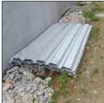
Na construção, placas iguais às que fechavam a obra do Teleférico

"Eu também utilizo o carro, mas para compromissos de trabalho e fiscalização, inclusive à noite, quando verificamos, por exemplo, a situação da iluminação pública na cidade. Quanto a estar na garagem, como mostra a foto, é verdade, às vezes costumo deixar estacionado no quintal enquanto entro em casa para pegar algo (documentos), para evitar danos e até furto, mas isso não significa que faço uso pessoal", finaliza.