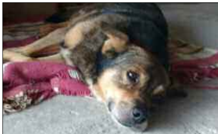
Tobias tem 18 anos e está com a pata ferida após ser atropelado