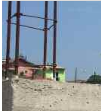
Material sendo retirado da obra do Teleférico. Material na obra particular