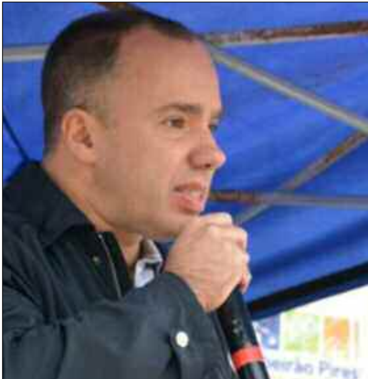
Prefeito encontra dificuldades nas licitações desde o início do mandato

Após barrar processo licitatório de R$ 13 milhões para equipamentos de festa, Tribunal vê possível confronto a jurisprudência da Corte