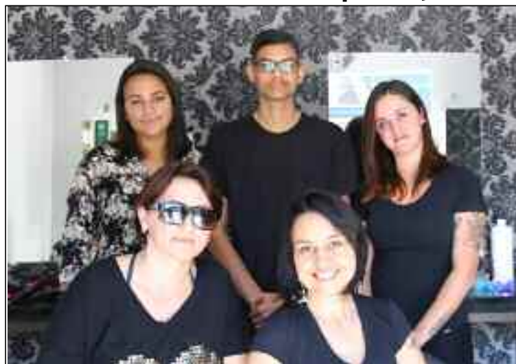
Equipe do salão Dani & Ela, inaugurado no último dia 4

O salão Dani & Ela foi inaugurado no último dia 4, sendo prestigiado com a presença de amigos e clientes. Sendo mais uma opção em Ribeirão Pires no ramo da beleza, o salão Dani & Ela atende com preços populares, oferece desde corte simples, químicas, estética, e depilação, até micro-pigmentação de sobrancelhas e capilares.