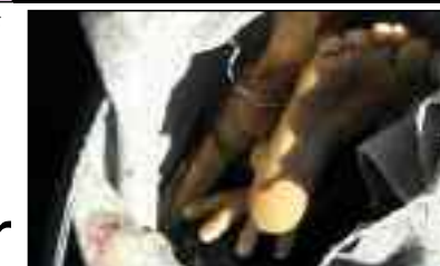
Amarrado e boiando em córrego