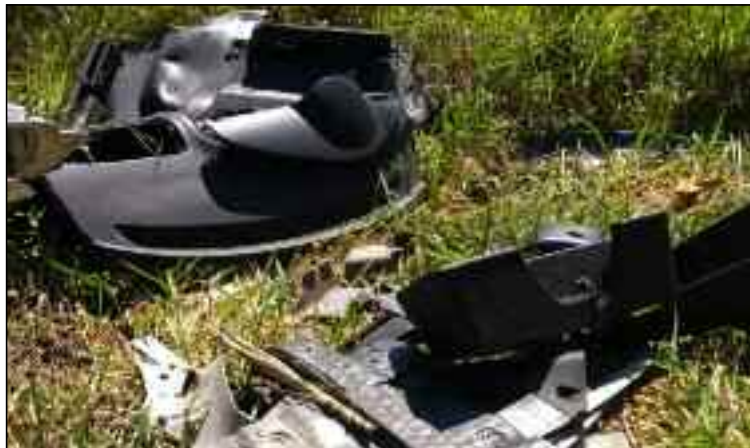
Pedacinhos de automóveis furtados e roubados foram encontrados no local

A Guarda Civil de Ribeirão Pires, em parceria com a Polícia Civil da Estância realizavam patrulhamento pela região da Quarta Divisão quando localizaram três pares de placas de veículos, além de outras 11 peças de automóveis no mesmo terreno.