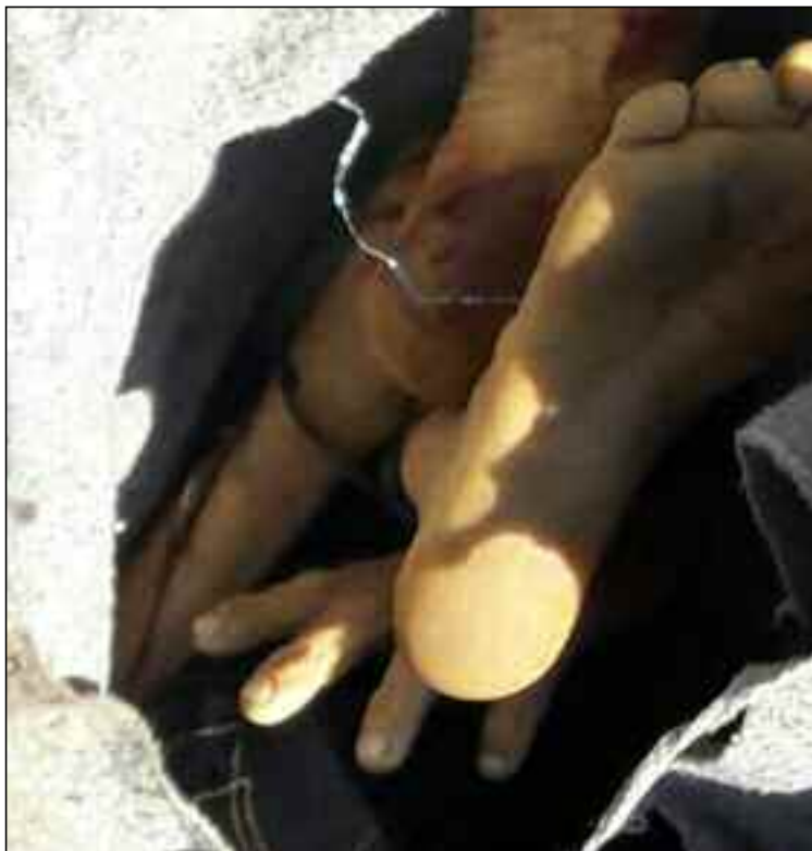
Amarrado com arame e envolvido em um cobertor, corpo estava em tambor

Tambor com a vítima estava boiando em um córrego na região do Jardim Zaíra 4