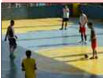
Time da Santa Tereza é participante

Promovida pela Secretaria de Esporte e Lazer da Prefeitura de Rio Grande da Serra, teve início, no sábado (16), a 1ª Copa de Futsal Sub 17 da cidade.