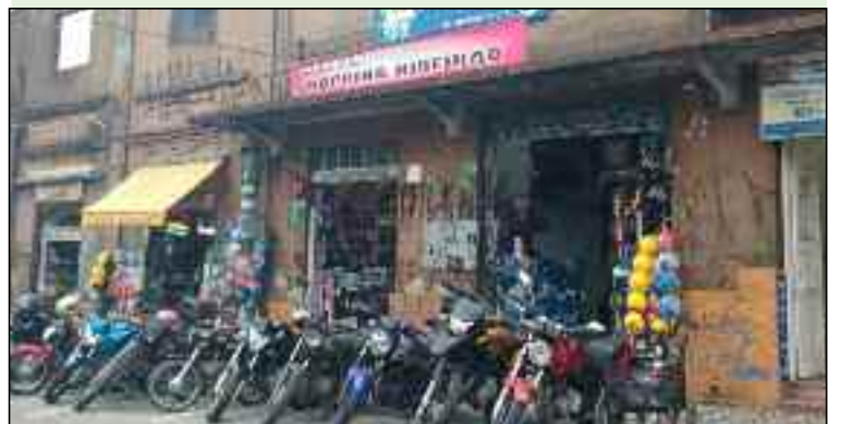
De acordo com BO, um dos casos aconteceu na avenida Capitão José Galo, 144

A Polícia Militar e Guarda Civil Municipal de Ribeirão Pires apreenderam no último dia 11, mais de 1750 pacotes de cigarros de marcas variadas, tendo em cada um deles, 10 maços de cigarros.